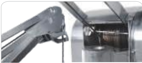
DOBLE FINAL DE CARRERA DE SUBIDA Y DE DESCENSO