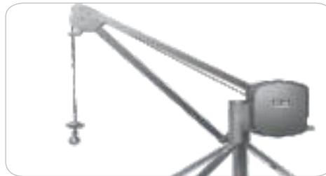
DIMENSIONI - DIMENSIONS - DIMENSIONS - ABMESSUNG - DIMENSIONES